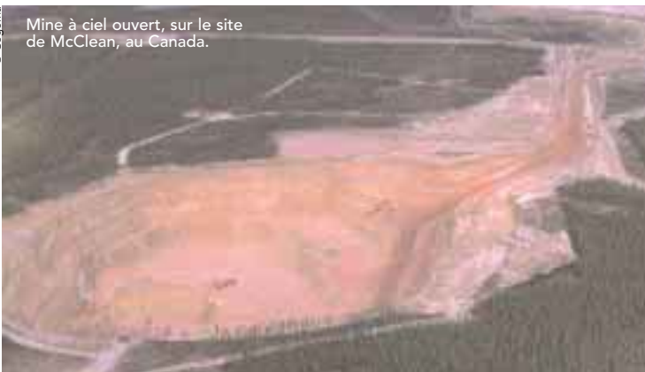
Mine à ciel ouvert, sur le site de McClean, au Canada.